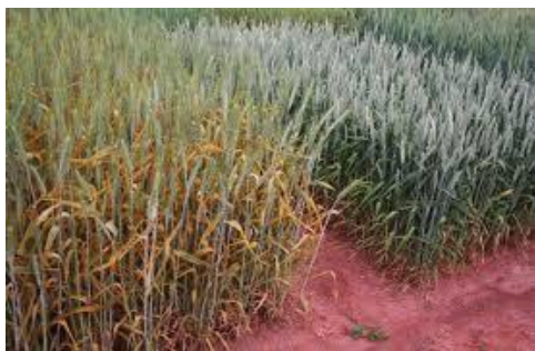
مقایسه مزرعه آلوده و سالم